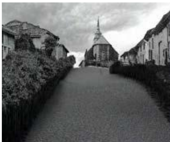
Photographie 1: Reconstitution de ce que fut le village de Vauquois, avant sa destruction en 1915.

Lieu symbolique des batailles de la Grande Guerre, Verdun témoigne encore, quatre-vingts ans plus tard, des désastres des combats. Enquête dans la zone de ce qui fut appelé « l'enfer de feu » à l'aide d'images et de témoignages actuels, de reconstitutions animées ainsi que des documents d'archives.