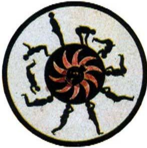
Figure 1 : Partie centrale d'un phénakistiscope de 1830. « Vive le cinéma : 100 ans déjà », © Télérama Junior, numéro hors-série, 1995.

Après avoir collé le document sur un support rigide, tracer un cercle de 10 cm de rayon autour du cercle découpé. Découper ce dernier cercle et pratiquer 10 ouvertures entre les deux circonférences.