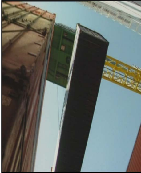
Image 6 - Le déchargement