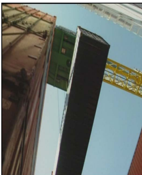
Image 6 - Le déchargement