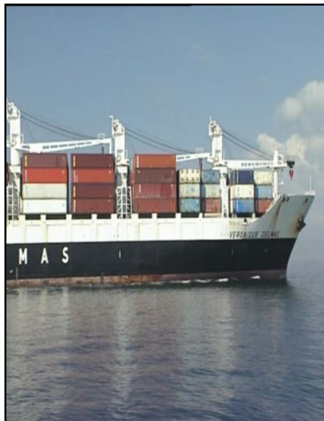
Image 1 - Le Véronique-Delmas

Range les photos dans l'ordre et écris une courte phrase pour raconter ce qui se passe sous chaque image.