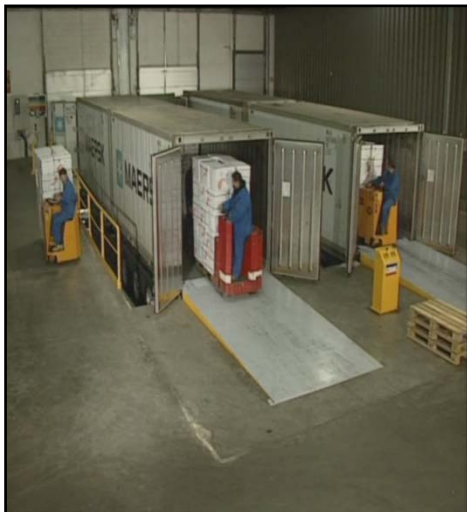
Image 7 - Le chargement des camions