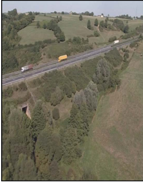
Image 2 - Les camions emmènent les marchandises