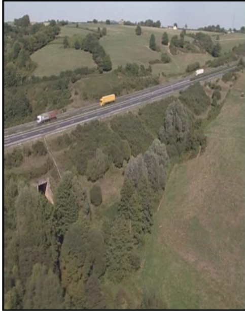
Image 2 - Les camions emmènent les marchandises