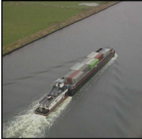
Image 4 - Les marchandises partent en péniches