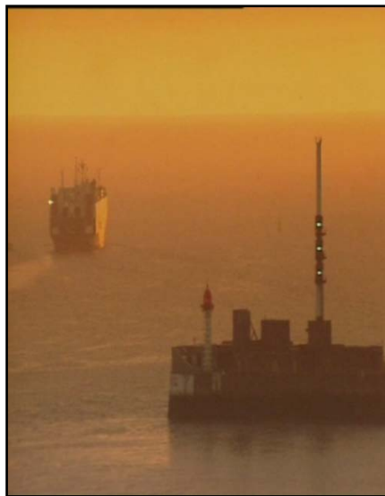
Image 5 - Le Véronique-Delmas reprend la mer