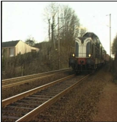
Image 3 - Le train emmène les marchandises