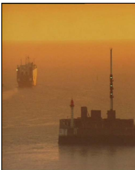
Image 5 - Le Véronique-Delmas reprend la mer