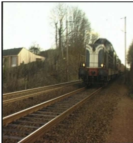
Image 3 - Le train emmène les marchandises