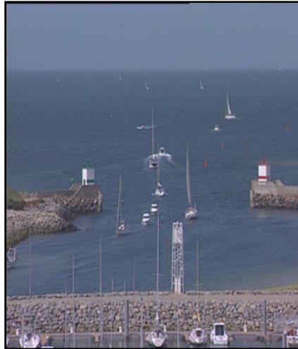
Image 2 - L'entrée du port de Croesty