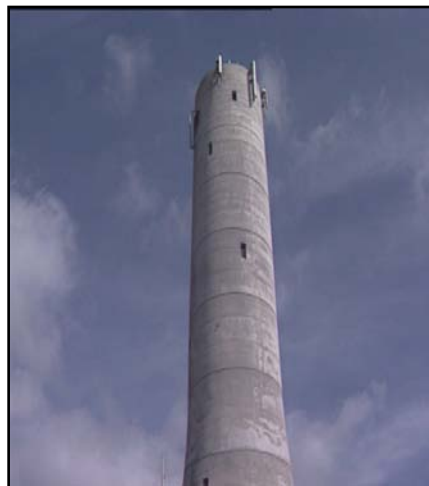
Image 3 - Le phare