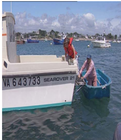
Image 8 - L'annexe