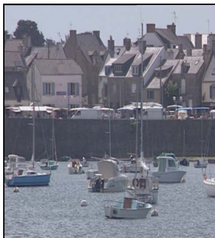
Image 1 - Port Navalo

En t'aidant des images et des mots écrits au tableau, écris trois ou quatre phrases pour décrire ce qu'est un port de plaisance.