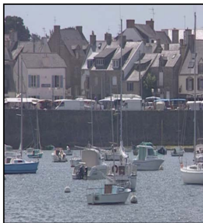
Image 6 - Le port de Navalo