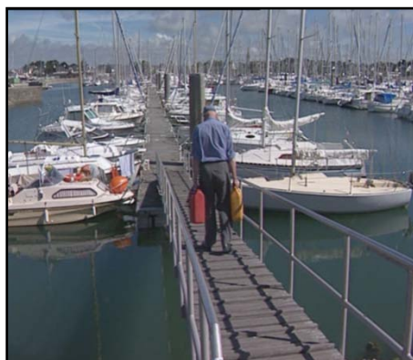
Image 11 - Le ponton