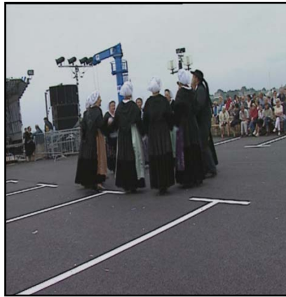
Image 5 - Une animation sur le port