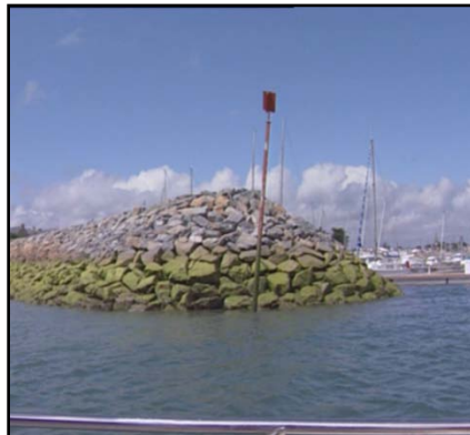
Image 9 - La digue de pierre du port de Croesty