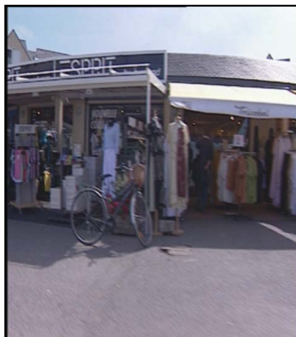
Image 4 - Les magasins