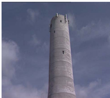
Image 10 - Le phare du port de Croesty