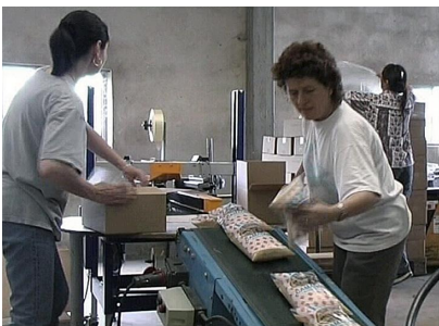
Illustration n° 4 – Des dames mettent les paquets de riz dans des cartons.