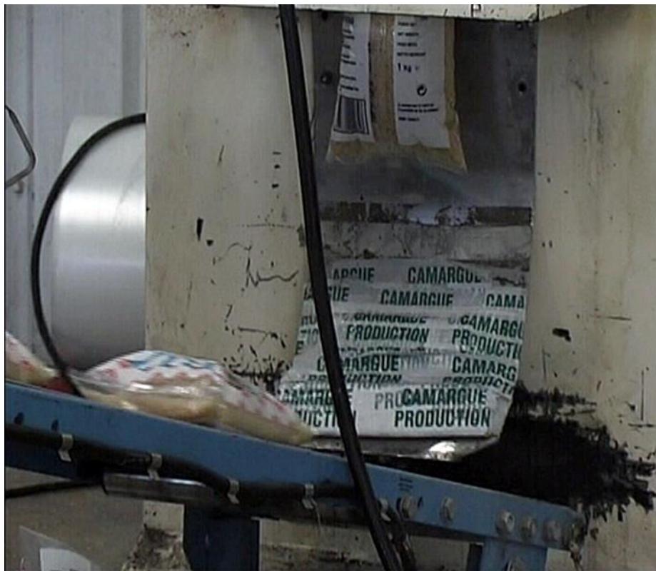
Illustration n° 3 – L'emballage du riz ..... .....