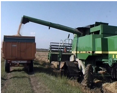
Illustration n° 2 – Les remorques des tracteurs sont remplies de grain de riz.