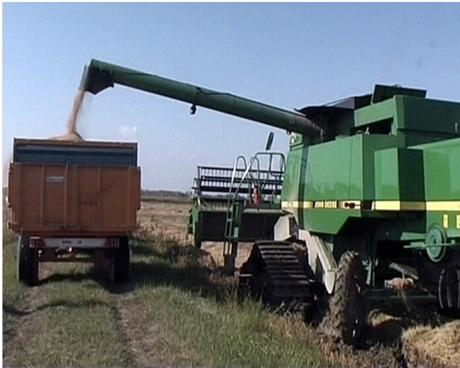
Illustration n° 2 – Les remorques sont chargées ..... .....