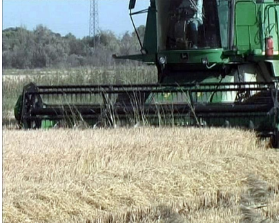
Illustration n° 1 – La moissonneuse-batteuse coupe le riz.