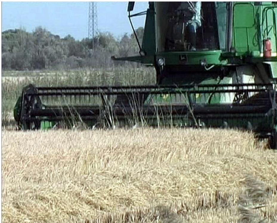
Illustration n° 1 – Le moissonnage du riz

Consigne : Observe bien chaque image. Classe-les pour montrer les différentes étapes de la culture du riz. Écris sous chaque illustration une petite phrase.