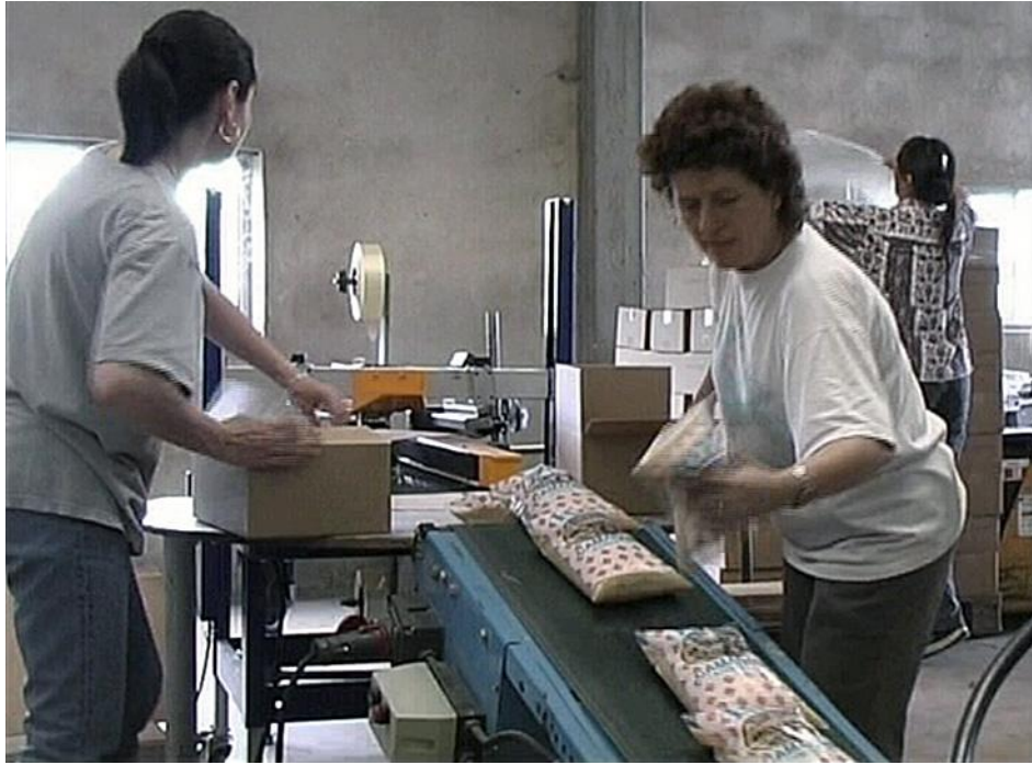
Illustration n° 4 – Les paquets de riz sont mis dans des cartons