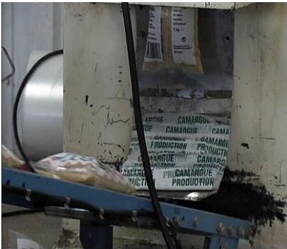
Illustration n° 3 – Des machines mettent le riz dans des paquets.