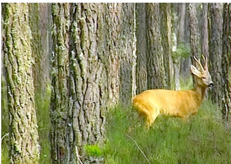
Illustration n° 2 – Le chevreuil