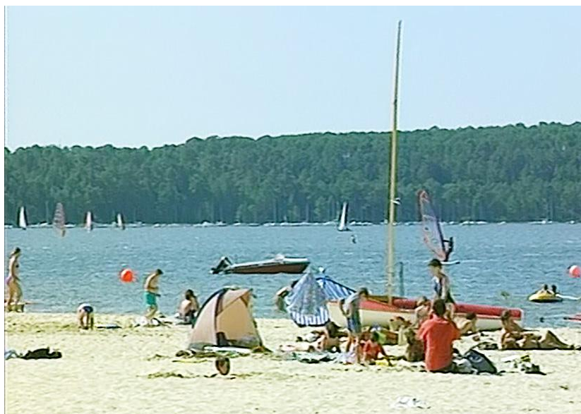
Illustration n° 4 – Le lac