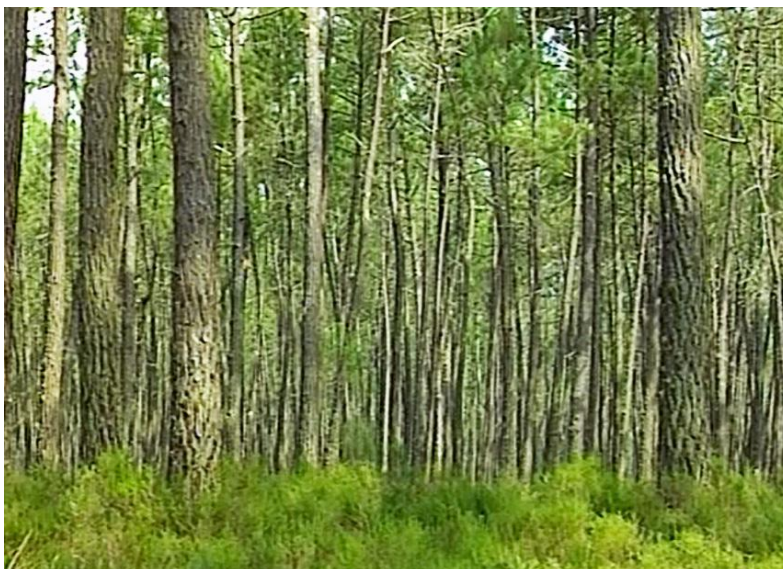
Illustration n° 1 – Une région de forêt

Consigne : en t'aidant des images et des mots écrits au tableau, écris deux ou trois phrases pour décrire ce qu'est une région de forêt.