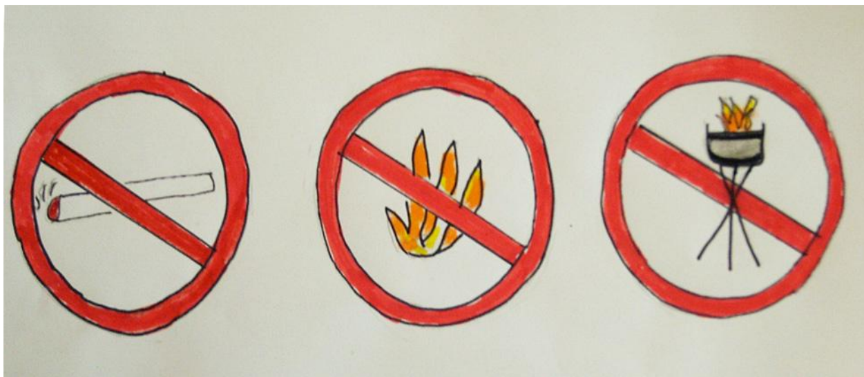
Illustration n° 5 – Proposition de corrigé

Activité 1 – Réaliser une pancarte qui pourrait être mise à l'entrée d'une forêt pour éviter les feux