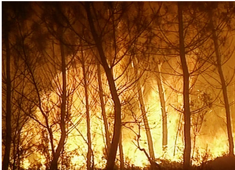
Illustration n° 3 – Le feu