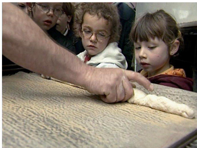
Illustration n° 8 – Les enfants observent le boulanger

Consigne : classe ces trois photos et fais une phrase ou deux pour expliquer ce qu'elles nous montrent.