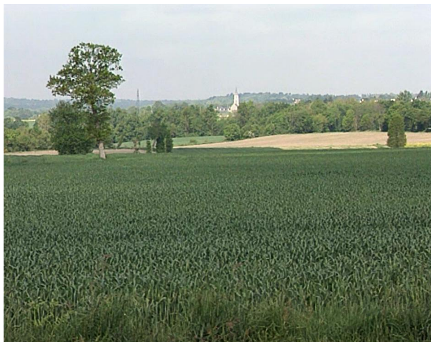
Illustration n° 4 – Les champs cultivés

Les illustrations 4, 5, 6 et 7 peuvent servir de supports visuels pour décrire le travail des agriculteurs de ce village.