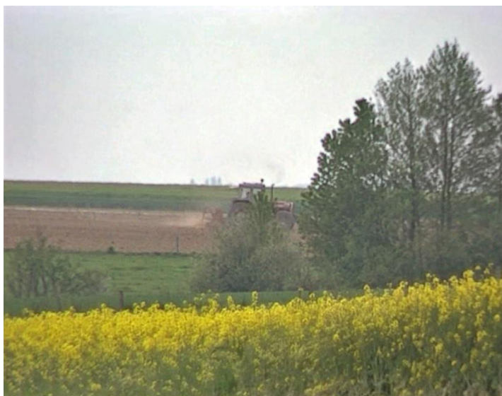
Illustration n° 5 – Les terres cultivées autour du village