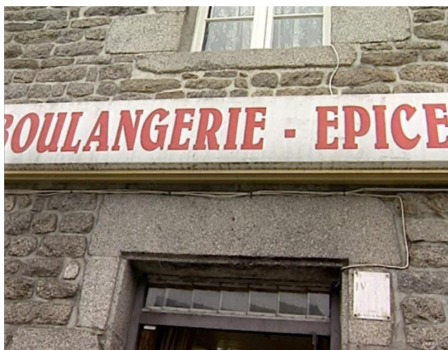
Illustration n° 2 – L'enseigne « Boulangerie-épicerie »