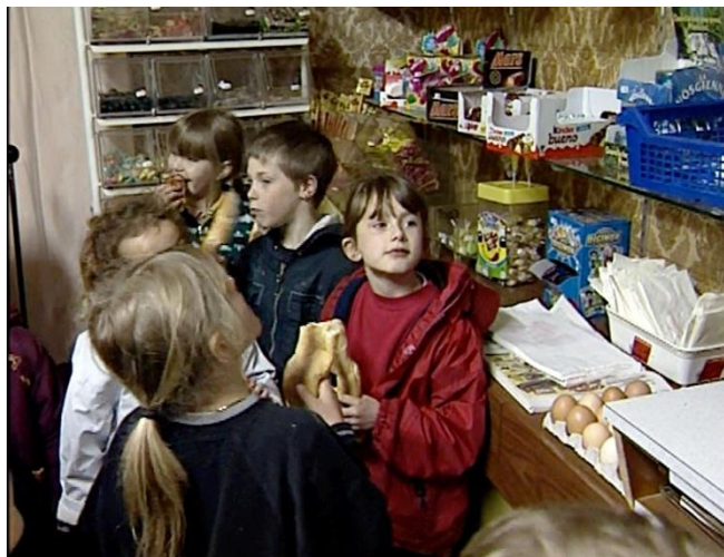
Illustration n° 1 – Les enfants dans la boulangerie

Projeter les illustrations 1, 2 et 3 pour répondre à cette question et mettre en évidence que les services offerts dans un village sont très réduits.