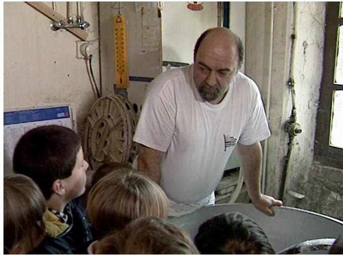
Illustration n° 9 – Les enfants autour du pétrin ..... .....