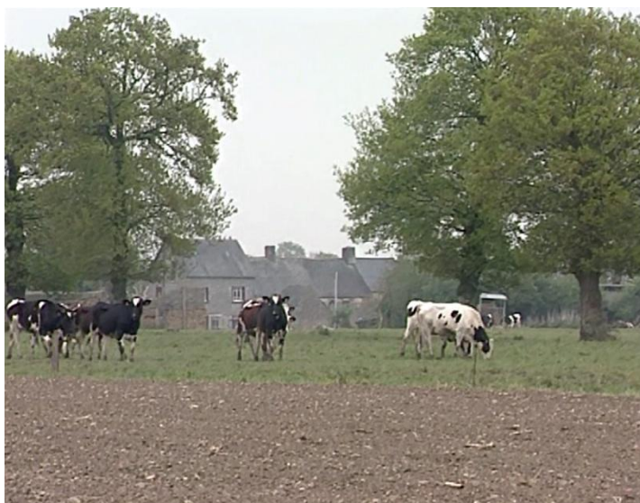
Illustration n° 6 – Des vaches aux abords d'une ferme