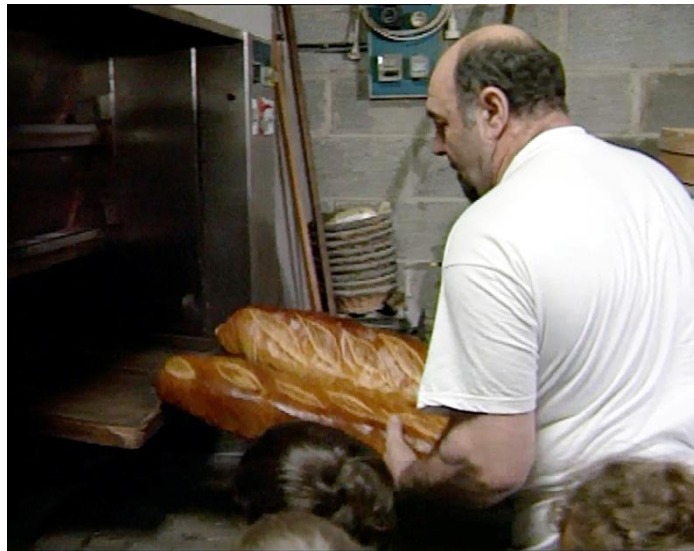
Illustration n° 10 – Le boulanger sort le pain du four ..... .....