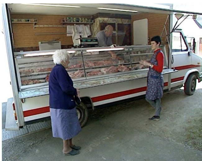
Illustration n° 3 – La camionnette du boucher-charcutier