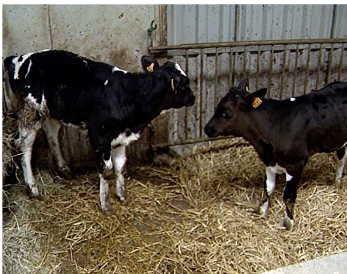
Illustration n° 7 – Les veaux dans l'étable