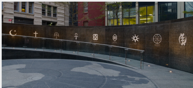
L'African Burial Ground National Monument, érigé à l'emplacement de l'ancien cimetière aux esclaves de New York.

En 1991, en plein Manhattan, alors que débutait la construction d'un gratte-ciel, la découverte de restes humains a fait cesser net les travaux: on venait de trouver l'ancien cimetière aux esclaves de la ville de New York en usage de 1697 à 1792 — plus de 15 000 personnes y ont été enterrées. Grâce à la mobilisation de la communauté afro-américaine, une opération archéologique et mémorielle a alors commencé. Un peu plus de 400 individus ont finalement été mis au jour et étudiés. Ainsi dévoilé, le passé esclavagiste de la ville, bien moins connu que celui du Sud, a dû être assumé. Les restes de ces hommes, femmes et enfants ont été réinhumés sur place en 2003, et un monument a été érigé en leur mémoire.