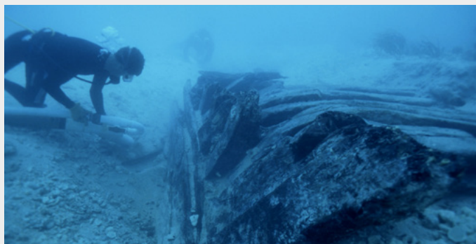
Fouille sous-marine autour de l'épave de l' Henrietta Marie , naufragée en 1700 au large de la Floride.

C'était un navire négrier ordinaire. Chargé de vaisselle en étain et de perles de verre, l' Henrietta Marie quitte Londres en septembre 1699. Sur les côtes d'Afrique occidentale, l'équipage troque sa cargaison contre de l'ivoire et plus de deux cents captifs – hommes, femmes et enfants. Puis le bateau reprend le large, direction la Jamaïque. C'est là, après deux mois de traversée enchaînés dans les cales, que les esclaves sont vendus. On charge alors du sucre, du coton, de l'indigo et du bois à revendre en Europe. Mais le navire sombre sur le chemin du retour, en mai 1700, emportant les espoirs de fortune de ses armateurs. Les vestiges archéologiques de cette folie commerciale ont été découverts sous les flots, au large de la Floride.