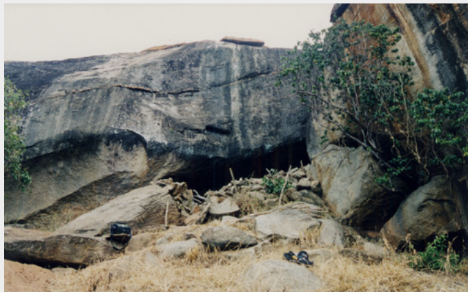
L'un des abris-sous-roche fortifiés utilisés pour échapper à la traite et aux violences, découvert sur le mont Kasigau au Kenya.

Il en a fallu des efforts, pour monter pierre à pierre des murets aussi épais, dans des endroits aussi inaccessibles. Sur le mont Kasigau, au sud du Kenya, ont été découverts les vestiges d'une trentaine d'abris naturels fortifiés. Ils servaient de refuges temporaires, où l'on se repliait en cas d'alerte. Nichés en pied de falaises, ils se fondaient dans le paysage, permettant d'observer discrètement les alentours à des kilomètres à la ronde. De quelle terrible menace fallait-il ainsi se protéger? Au moment de l'utilisation de ces abris de montagne, entre le XVIII e et le XIX e siècle, les razzias d'hommes se multipliaient. Sur la côte, la traite négrière battait son plein.