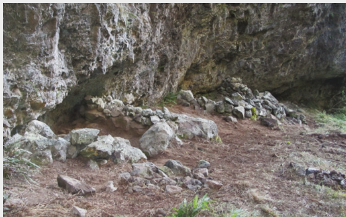
Structures en pierres sèches, vestiges de deux abris découverts dans une petite vallée du cirque de Cilaos à La Réunion ; le site a été fouillé en 2011 et en 2012.

Très montagneux, l'intérieur de l'île de La Réunion était un terrain propice pour les « marrons », ces esclaves qui refusaient de l'être et préféraient la fuite. En 1995, à 2 000 mètres, un guide de montagne a trouvé au fond d'une petite vallée encaissée les vestiges de deux abris. À une telle altitude, ce site accessible uniquement en rappel pouvait-il être lié au marronnage ? Une fouille archéologique l'a confirmé. Occupé au début du XIX e siècle, ce refuge secret servait aussi de halte de chasse : une parfaite connaissance de l'île permettait aux marrons d'échapper à la traque incessante des « chasseurs de nègres » en vivant de chasse et de cueillette.