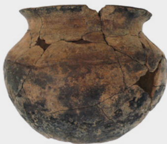
Marmite de tradition africaine en terre cuite, après recollage. Elle a été découverte lors de la fouille d'une habitation-sucrierie à Saint-Claude en Guadeloupe.

Elle a fini à la poubelle, cette marmite. Et c'est dans la fosse où on l'avait jetée, sur le site d'une ancienne habitation-sucrierie de Guadeloupe, qu'un archéologue l'a retrouvée. Pourquoi s'intéresser à cette modeste poterie? C'est qu'elle n'a rien d'européen ni d'amérindien, et qu'elle ressemble indéniablement par sa forme et son mode de fabrication aux poteries d'Afrique de l'Ouest. Rarement mentionné dans les archives, ce genre d'objet était certainement fabriqué par les esclaves pour eux-mêmes, selon des savoir-faire traditionnels. Une production discrète côtoyait donc la masse des céramiques que les esclaves fabriquaient utilisant des techniques européennes pour la production industrielle du sucre.