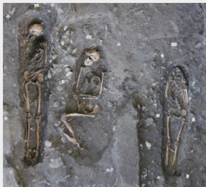
Les sépultures 53, 48 et 51 (de gauche à droite) découvertes à l'Anse Bellay. L'individu de la sépulture 51 présente des incisives supérieures taillées en pointe, pratique initiatique africaine.

Petite baie au sud-ouest de la Martinique, l'Anse Bellay n'est accessible que par la mer ou le sentier littoral. En ce lieu isolé, un crâne affleurant près du rivage a interpellé un randonneur. Appelés en urgence, les archéologues ont mis au jour les sépultures de 27 adultes, 2 adolescents, 13 enfants et 6 nouveau-nés. Ils avaient été enterrés en pleine terre, probablement nus dans un simple linceul, orientés est-ouest conformément aux pratiques catholiques. Certains avaient les incisives taillées selon des traditions africaines. Tout concourt donc à identifier le site comme un cimetière d'esclaves. Sur cette bande de terre littorale, des hommes et des femmes se sont emparés de la religion imposée par leurs maîtres pour offrir des funérailles à leurs proches.