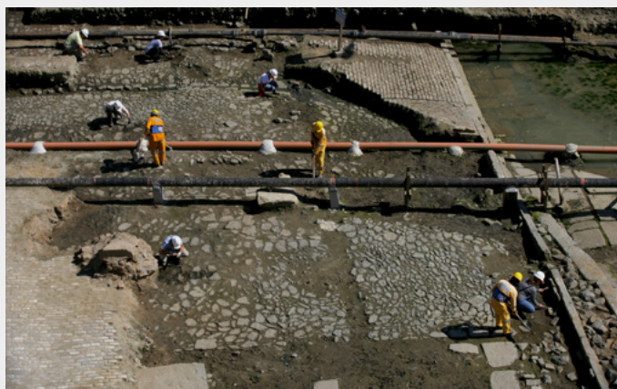
Fouille du quai de Valongo, réalisée à Rio de Janeiro au Brésil en 2011. On y reconnaît les deux strates de chaussée successives.

À l'occasion du réaménagement de la zone portuaire de Rio de Janeiro, avant les JO de 2016, une fouille a révélé au grand jour tout un pan du passé de la ville. Sous le bitume carioca, les archéologues ont dégagé les vestiges de deux quais superposés. Construit en 1811, le plus ancien et le plus vaste, appelé quai de Valongo, était destiné aux bateaux négriers. Pendant trois décennies, quelque 900 000 Africains y ont transité contre leur gré. Puis, en 1843, le débarcadère aux esclaves a été remblayé et recouvert d'un quai flambant neuf, digne de recevoir l'impératrice Thérèse-Christine de Bourbon-Siciles, venue épouser l'empereur Pierre II.