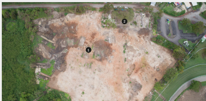
Vue zénithale du site de fouille, en bordure de l'hippodrome, en Guadeloupe. On distingue ❶ les bâtiments industriels et ❷ le quartier d'esclaves.

Sur ces terres, l'hippodrome de Guadeloupe dessine une grande forme oblongue, mais il n'en a pas toujours été ainsi. En fouillant les abords de la piste, les archéologues ont retrouvé les traces d'une purgerie, d'une sucrerie et de multiples rangées de cases rectangulaires formant un quartier d'esclaves. Une habitation-sucrerie se trouvait donc ici. Ce genre de domaine comprenait plantations, ateliers de transformation, rues « cases-nègres » et maison du maître. Il permettait au colon d'exercer un contrôle permanent sur ses esclaves. Produit ainsi à moindre coût, le sucre était vendu fort cher en métropole. En 1830, à l'apogée du système des habitations-sucreries, la Guadeloupe en comptait plus de 600, qui employaient près de 90 000 esclaves.